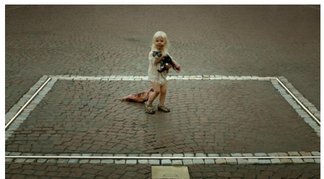
Ruben Östland - The Square - 2017