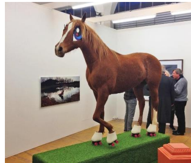
TINKEBELL -. My little pony - 2012