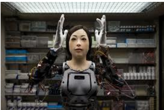
Dries Verhoeven - Happiness - 2019