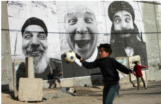
JR - Face to Face. Jeruzalem - 2007